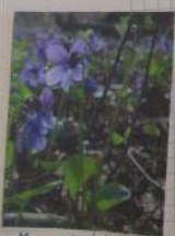
Bedrose - Vergissmeinnicht